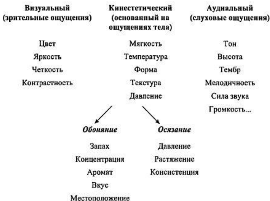
Рис. 1. Каналы восприятия информации

Так, студенты с преобладающим визуальным каналом восприятия информации (визуалы) много читают и вследствие этого получают большее представление о характере и структуре учебного материала. Они лучше воспринимают новый материал, когда он написан в книге, на доске, представлен схематически. Визуалы лучше справляются с письменными заданиями и контрольными работами, чем пересказывают текст устно. Аудиалы лучше воспринимают тексты на слух, с большей охотой слушают лекции. Моторные студенты лучше усваивают материал, когда могут использовать его в ролевой игре.