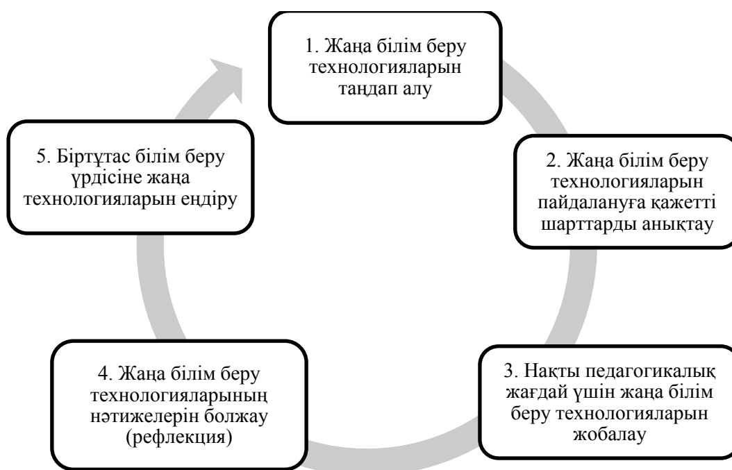
1 сурет - Мұғалімнің орта мектеп жүйесінде жаңа білім беру технологиясын іске асыру үдерісі

Орта мектеп жүйесінде жаңа білім беру технологияларын іске асыру бойынша мұғалім қызметін зерттеуде өз бетінше ұйымдастырылатын жүйелердің бір сападан келесі жағдайға өтуін зерттеу маңызды болып табылады. Синергетика ашық жүйелердегі үдерістермен шұғылданады. Мұнда сыртқы ортадағы өзгерістер оның тепе - теңдігін бұзып, онда басқа сапалық жағдайларды орнықтырады [5, 21].