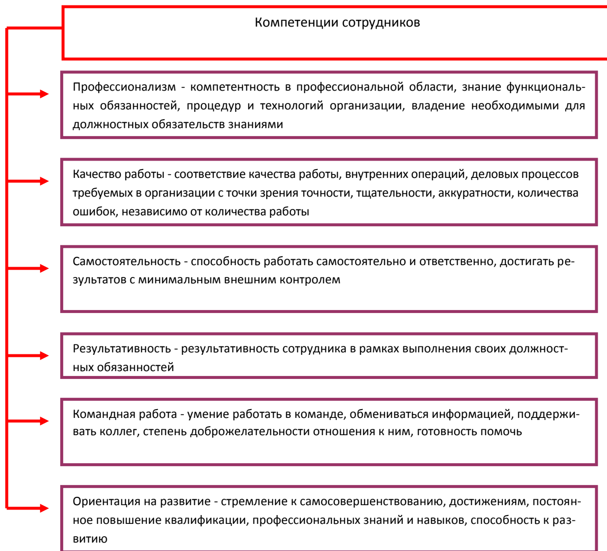
Рисунок 1. - Описание характеристик для проведения метод «360 0 » [9].

Анализ информации показывает производительность, саморазвитие, уровень квалификации и другие параметры предприятия, рассмотренные на рисунке 1.